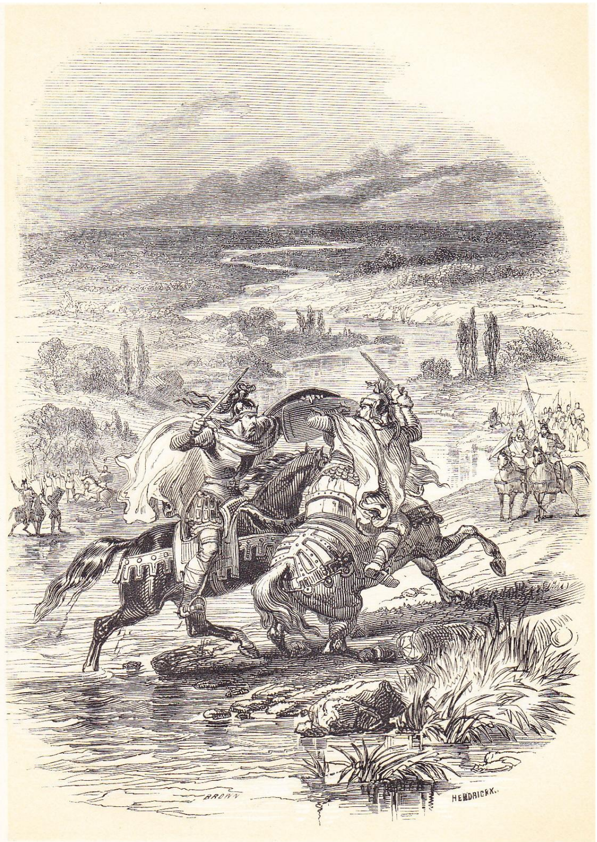
Combat de Clothar et de Bertoald.